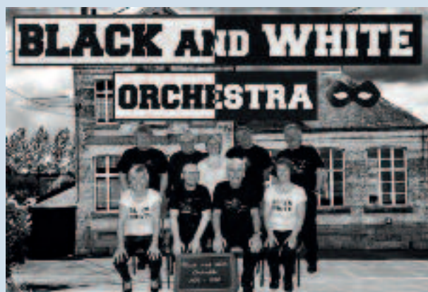
Set "Années 70"