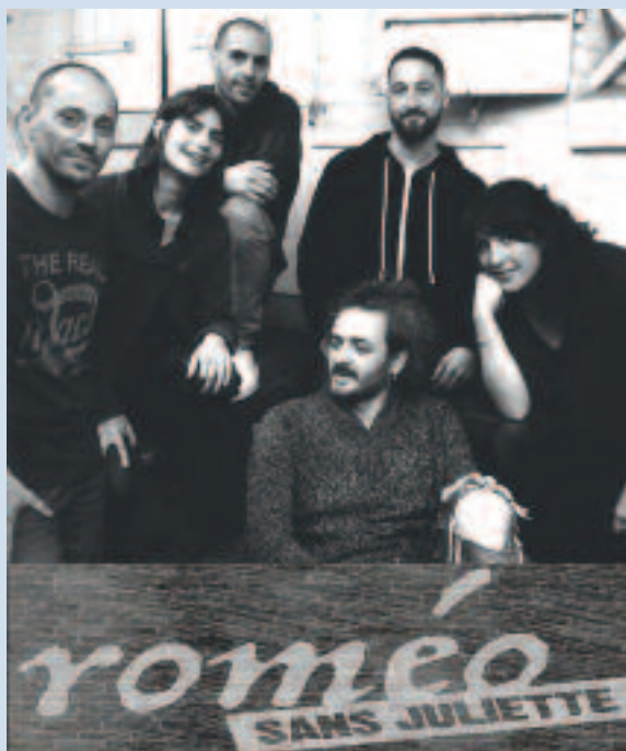
Chansons festives à texte